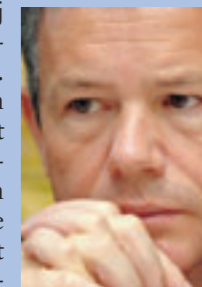
Frank Vanhecke (Vlaams Belang).

Vandeurzen zegt dat hij “een aantal bevoegdheden” wil regionaliseren. Vaagheid troef dus. In het verleden heeft CD&V de Belgische belangen steeds verkozen boven de rechtvaardige Vlaamse eisen, en dat zal na 10 juni niet anders zijn. De “vijf minuten politieke moed” van Yves Leterme om Brussel-Halle-Vilvoorde te splitsen zijn legendarisch. Aan de miljardenstroom naar Wallonië zal ook met Leterme en Vandeurzen niet worden geraakt. Tot slot :